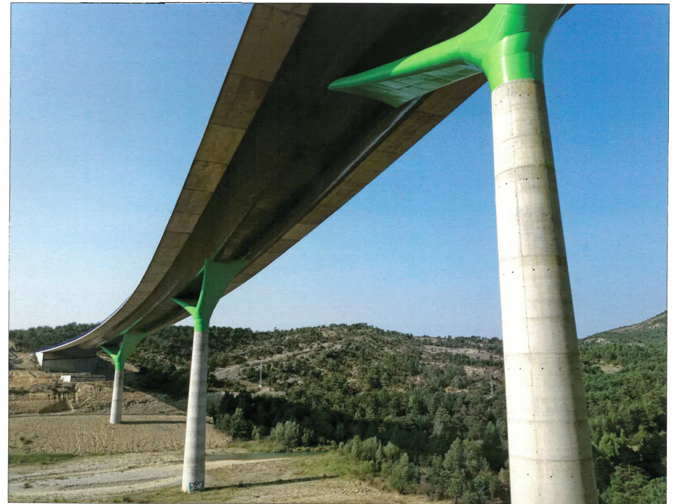
► Vista del viaducto sobre el río Guarga ya terminado.

cutados con el apoyo de un carro de encofrado. La transmisión de esfuerzos entre el hormigón y el acero del tablero se ha asegurado mediante la disposición de 50.000 conectores metálicos. Por último, se ejecutó la barrera de hormigón que separa las dos calzadas y, en los laterales del tablero, las aceras y los correspondientes pretilos de defensa, además de diversos acabados. Con ello el tablero ha quedado preparado para recibir la capa de firme, que según el proyecto estará constituida por un paquete de 8 centímetros de espesor formado por una capa de regulación de 5 centímetros y una capa de microaglomerado de 3 centímetros.